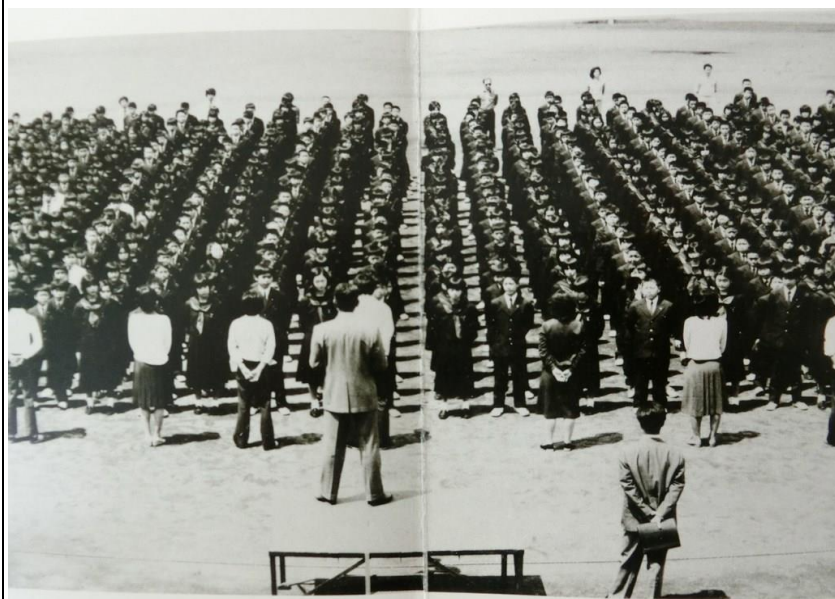
上と右上・・・1982年 卒業アルバムから掲載

今後、標準服とジャージの変更を保護者からの意見も聞きながら、PTAと連携していきたいと考えています。学校の応援団である学校評議員のメンバーに、歴代の相模丘中PTA会長の方がいます。その方が現職だった十数年前、やはり標準服変更の検討をしたそうです。しかし、現在の標準服を継続して着用したいとの意見が多く、変更は見送られたとのことでした。令和3年、標準服とジャージの変更を多角的な視野から検討したいと思います。