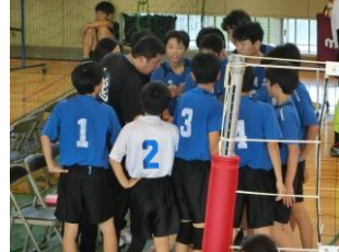
男子バレーボール部