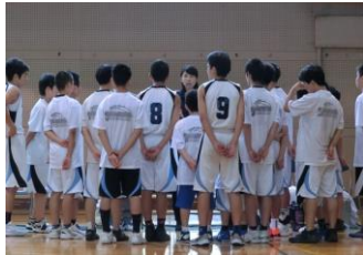
男子バスケットボール部