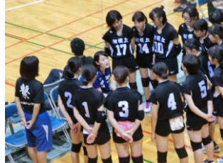
女子バレーボール部