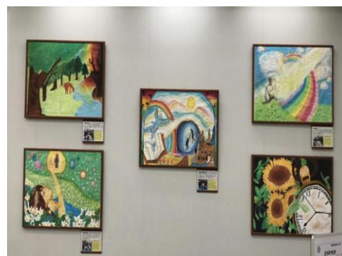
(女子美大に展示したイメージ画)

3年生は進路決定に向けて大詰めを迎えています。ただ進路決定と言っても、高校進学が最終目的ではなく、将来を見据えて今何をすべきか、何を身につけて社会に出て行くかが重要です。その意味からも「自律」と「自立」を身につけて行くことが大切になってきます。