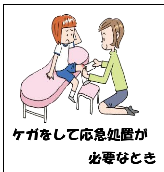
ケガをして応急処置が必要なとき