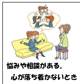
悩みや相談がある。心が落ち着かないとき