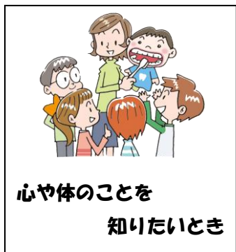
心や体のことを知りたいとき