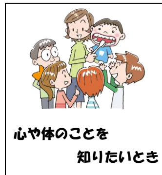
心や体のことを 知りたいとき