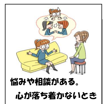
悩みや相談がある。 心が落ち着かないとき