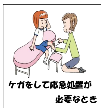
ケガをして応急処置が 必要なとき